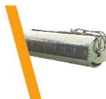
▼ Rodillo liso Vibratorio