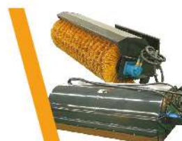
▼ Barredora con o sin cajón