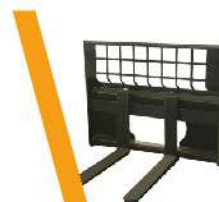
▼ Porta Pallets