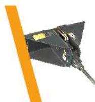
▼ Martillo Hidráulico