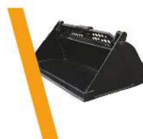
▼ Balde 4 en 1