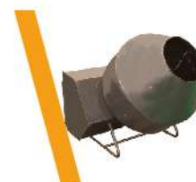
▼ Mezcladora de Hormigón